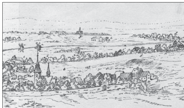
Älteste Ansicht von Plauen und seiner Kirche (Dilich 1627)

Im Jubiläumsjahr soll durch einige Veranstaltungen verdeutlicht werden, wie die Kirche und ihre Gemeinde durch die Jahrhunderte geleitet und bewahrt wurden. Dass dabei die Reformation Luthers nicht ganz unter den Tisch fällt, ist selbstverständlich – 500 Jahre evangelisch-lutherischer stehen schließlich gegen (mehr als) 50 Jahre „papistischer“ Zeit!